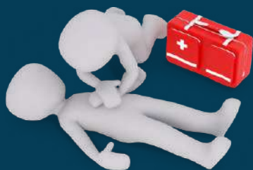
PRIMEROS AUXILIOS (TEORIA-TALLER)