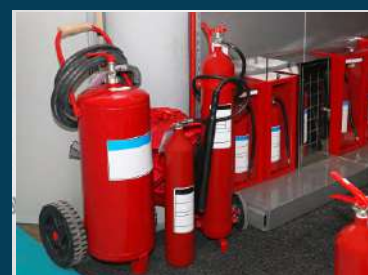
USO Y MANEJO DE EXTINTORES