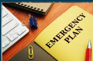
PREPARACIÓN PARA LA EMERGENCIA