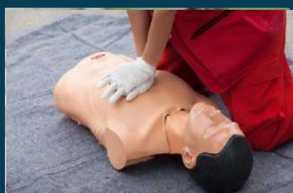
CAPACITACIÓN DE BRIGADAS (PRIMEROS AUXILIOS, EVACUACIÓN E INCENDIOS)