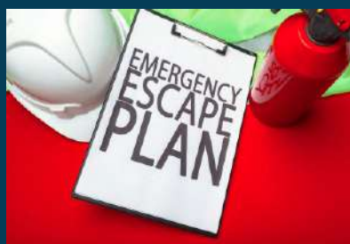
PLANES DE EVACUACIÓN