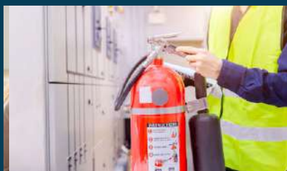
SEGURIDAD Y LUCHA CONTRA INCENDIOS