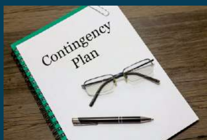
PLAN DE CONTINGENCIA Y NORMATIVA DE LA GESTIÓN DE RIESGOS Y DESASTRES