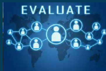
SIMULACROS DE EVALUACIÓN